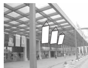
Zastava 1,5 x 3 m

SPONZORSKI PAKETI I OSTALI PAKETI MARKETINŠKIH USLUGA UGOVARAJU SE PO POSEBNIM PONUDAMA. TEL. 021/483-11-32