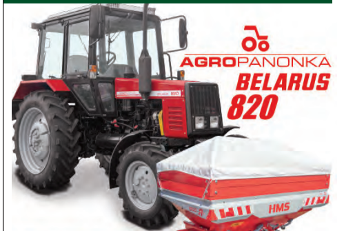
Расипач ХМС-А 1000