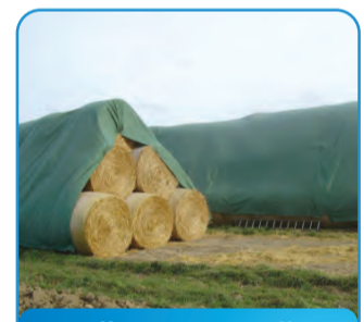
ZAŠTITNA MREŽA ZA BALE