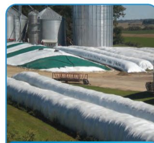
SILU CREVA – KOBASICE