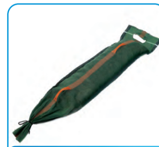
TEG ZA SILAŽU