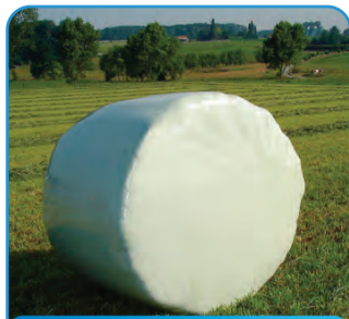
FOLIJA ZA OKRUGLE BALE

Nalazimo se na OTVORENOM na aleji nacije ispred Hale 5