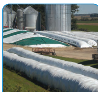
SILO CREVA - KOBASICE