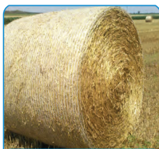
MREŽA ZA OKRUGLE BALE

PODFOLIJA 40 mikrona od 10,00 do 22,00 metara rolna: 100 metara