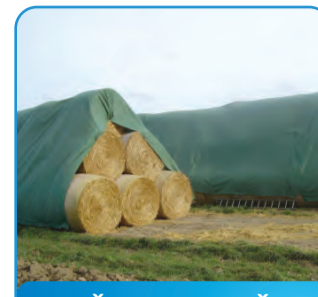
ZAŠTITNA MREŽA ZA BALE