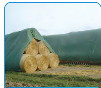
ZAŠTITNA MREŽA ZA BALE