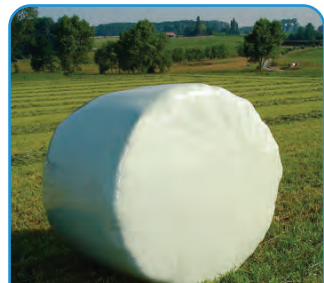
FOLIJA ZA OKRUGLE BALE