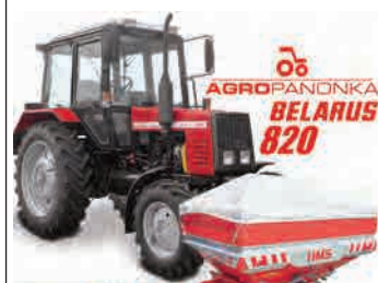
Расипач ХМС-А 1000