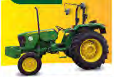
John Deere 5045D