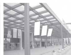
Zastava 1,5 x 3 m

NAPOMENA: · SVE CENE SU IZRAŽENE BEZ PDV-A, KOJI ĆE U FAKTURI BITI OBRAČUNAT U SKLADU SA VAŽEĆIM ZAKONSKIM PROPISIMA U VREME IZVRŠENJA USLUGA. PDV PADA NA TERET KUPCA. · POTPISIVANJEM OVE PRIJAVE - UGOVORA, IZLAGAČ JE SAGLASAN SA OPŠTIM USLOVIMA UGOVARANJA, KOJI SU SASTAVNI DEO OVE PRIJAVE - UGOVORA, KAO I SA NAČINOM PLAĆANJA NAVEDENIM U OPŠTIM USLOVIMA. U SLUČAJU SPORA NADLEŽAN JE STVARNO NADLEŽNI SUD U NOVOM SAĐU. · PODNETA PRIJAVA JE NEOPOZIVA I OBAVEZNA ZA IZLAGAČA UKOLIKO JE NE OTKAŽE ISKLJUČIVO PISANIM PUTEM 30 DANA PRE OTVARANJA SAJAMSKE PRIREDBE.