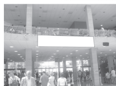
Transparent 5 x 1 m