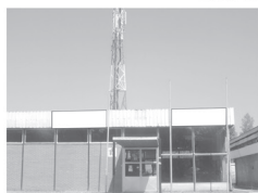
Transparent 3 x 1,5 m