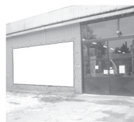
Transparent 5 x 3 m