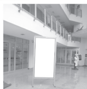
Pano 1 x 2 m