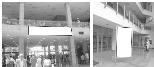
Transparent 5 x 1 m