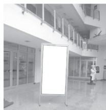
Pano 1 x 2 m