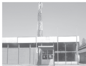
Transparent 3 x 1,5 m