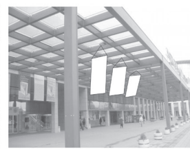
Zastava 1,5 x 3 m

SPONZORSKI PAKETI I OSTALI PAKETI MARKETINŠKIH USLUGA UGOVARAJU SE PO POSEBNIM PONUDAMA. TEL. + 381 21/483-11-25.